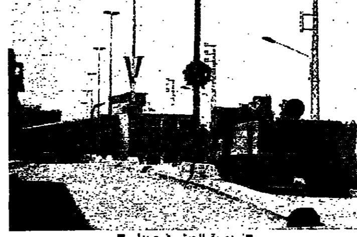
تورية الجيش في صيدا